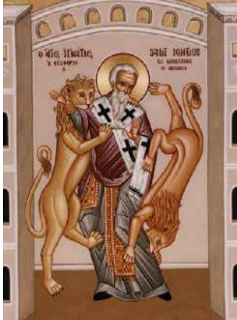
Ignác z Antiochie

s nimi byly vedeny procesy kriminální nebo pro narušování obecného pořádku. K trestům pak patřilo upálení, ukřižování nebo roztrhání šelmami v cirku.