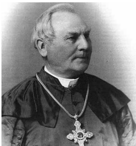
Josef Hubert Reinkens

K volbě prvního starokatolického biskupa došlo 4. června 1873 v Kolíně nad Rýnem poté, co byla povolena pruským ministerským předsedou a říšským kancléřem Bismarckem. Shromáždění 21 kněží a 56 laiků zvolilo za prvního německého starokatolického biskupa breslauského profesora teologie