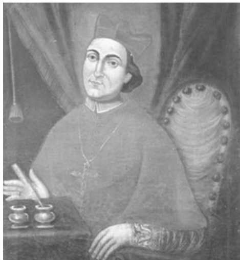
Kardinál Scipio Rebiba

Historická biskupská posloupnost současného českého starokatolického