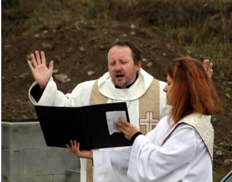
Biskup Pavel Benedikt při otevření nové modlitebny v Pelhřimově

Asi ne. Já jsem poměrně odolná povaha, duchovní docela dobře znám, včetně jejich silných a slabých stránek, takže se asi žádné překvapení nekonalo.