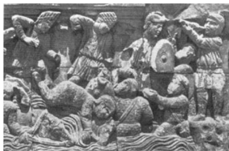
Bitva u Milvijského mostu

žádná výjimka. Křest byl obecně chápán jako jediný prostředek odpuštění smrtelných hříchů, proto lidé často křest odkládali až na smrtelnou postel.