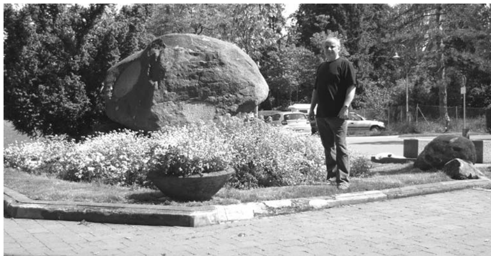
Místo upálení Jana Husa