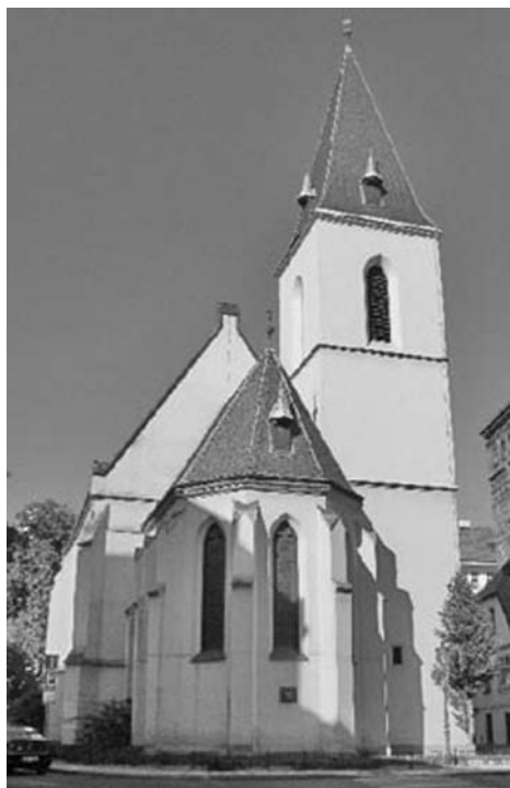
Kirche in Deutschland (EKD)), nikoli starokatolické církve (Alt-Katholiken Kirche in Deutschland).

Vím, že se se svou ženou Sybille učíte česky. Je pro vás (nebo byl na počátku) odlišný jazyk a trochu jiná liturgie velkou překážkou při prožívání společenství při starokatolických bohoslužbách?