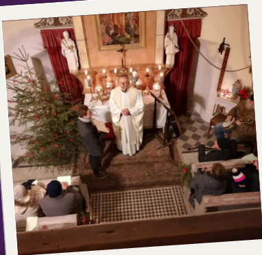
Půlnoční mše ve Cvikově