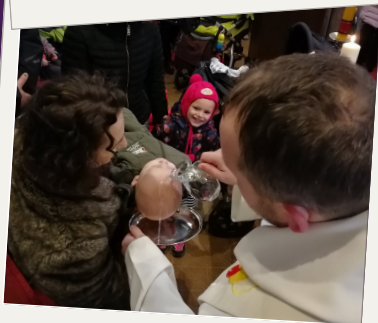
Křest ve Zlíně