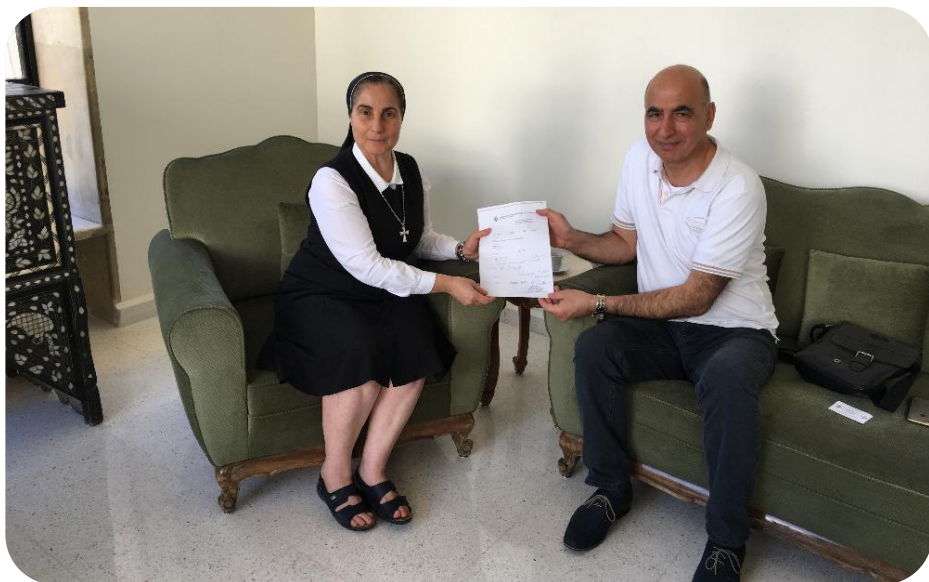
Předání pomoci pro sirotčinec sv. Pavla v Sýrii, který provozuje melchitský řecko-katolický patriarchát