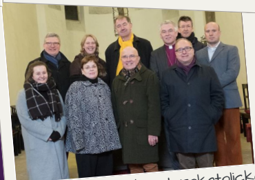
Setkání anglikánsko-starokatolické Komise v Praze