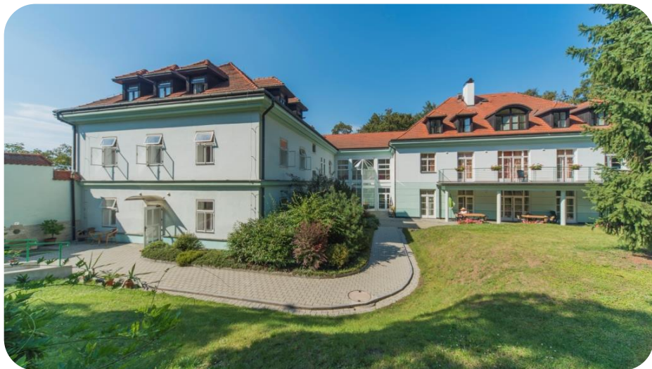
Hospic Štrasburk, druhý nejstarší hospic v ČR