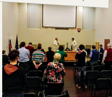
Biskupská vizitace v Bratislavě