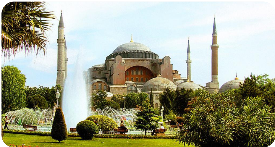
Chrám Boží moudrosti „Hagia Sofia“

Nedávno jsem zaznamenal postesknutí si jednoho bratra, že málokdo ví, co je to filioque a proč v Krédu nerecituje, nebo nezpíváme „...i ze Syna vychází“. Dovolím si tedy nabídnout vám stručný popis toho, o co jde.