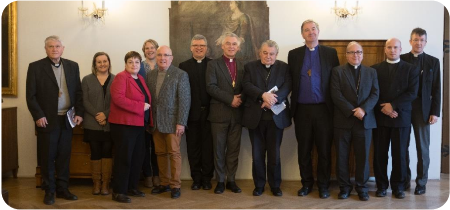
AOCICC s kardinálem Dukou a biskupem Malým

Ve dnech 16. – 19. ledna 2019 se v Břevnovském klášteře v Praze sešla Anglikánsko-starokatolická mezinárodní koordinační rada. Letošní zasedání bylo věnováno přípravě zprávy o vzájemné spolupráci za období 2013-2019 a otázky ochrany nezletilých a zranitelných dospělých v církevním prostředí.