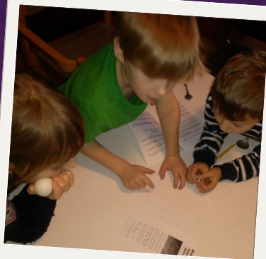
Ekumenické náboženství v Táboře

Najdete nás také na webu a sociálních sítích!