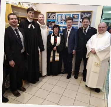
Alianční modlitební týden v Šumperku